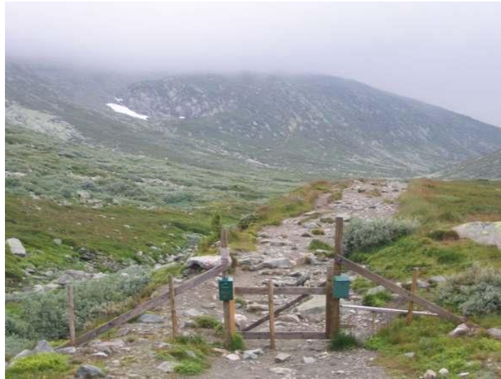
(Voilà à quoi nous avons échappé !!)

Je me caille dans la dernière descente et je n'arrive plus trop à tenir une position aéro. Les 25km derniers sont roulants et la température remonte. De temps en temps nous rattrapons des concurrents. Après 9h45 de vélo nous arrivons à T2. Nous rangeons les vélos dans la voiture et passons par la zone de transition. Nouveau change intégral. Il ne fait pas froid, nous partons à une bonne petite allure qui va durer jusqu'au 20ème. (10/11km/h) Au 17ème je reçois un petit coup de fil de Romuald, il m'apprend que l'ascension de la montagne ne se fait pas car le temps est trop mauvais en haut et qu'il vient de terminer 2ème.