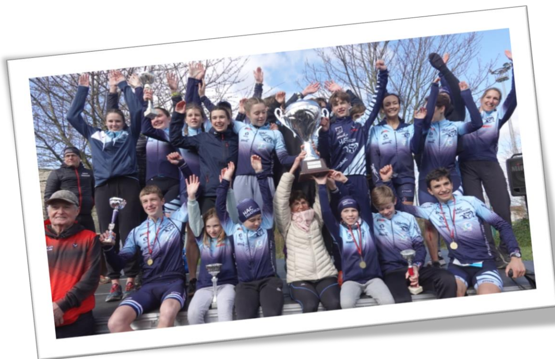
Le HAC Vainqueur du Challenge « La Birot » récompensant l'école de Tri la plus représentée