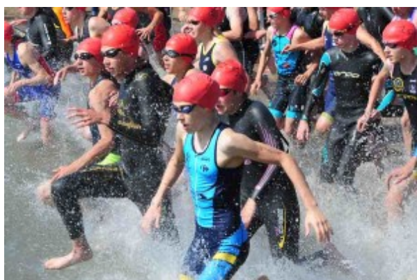
Départ de la course minimes